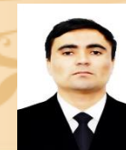
РОФИЗОДА ХОКИМБЕК ХОДИМИ ИЛМӢ