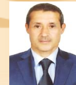
Мунаваров Шахобиддин ХОДИМИ КАЛОНИ ИЛМИ